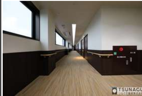
廊下 居室ドアは自動