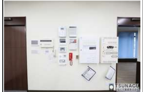
集中監視装置、非常通報装置、空調、 照明一括コントロール