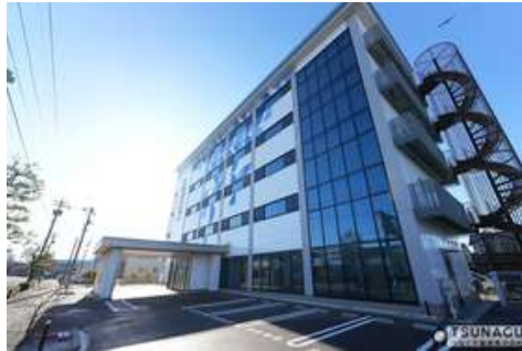
外観写真 来客用駐車場8台有り